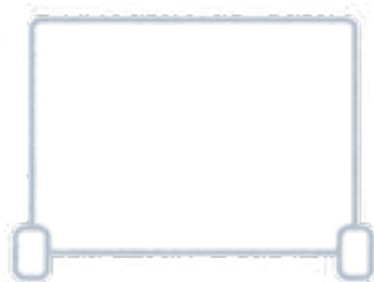
飛沫防止パネルの設置