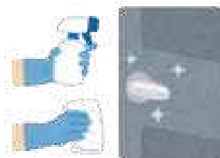
館内消毒作業の徹底