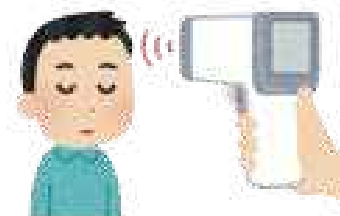
来館者全員への検温実施