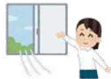
館内各所の換気実施