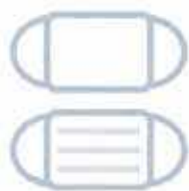
従業員のマスク着用