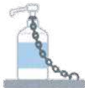
アルコール消毒液の設置