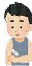
従業員の健康管理実施